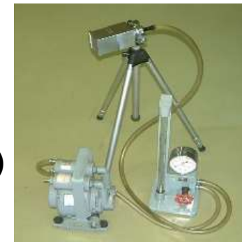
試料採取機器 （サンプラー及びポンプ）