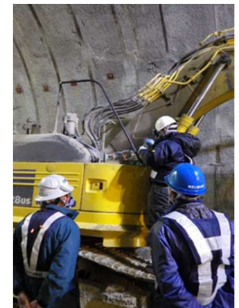
(3) 車両系機械を用いた測定