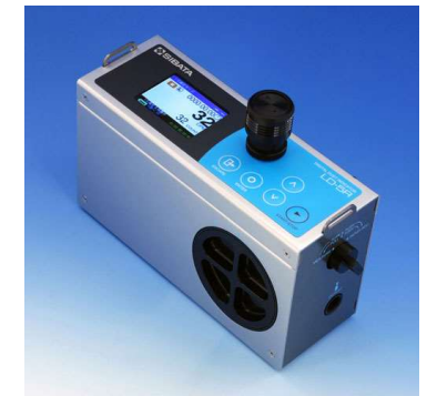
相対濃度計 （デジタル粉じん計）